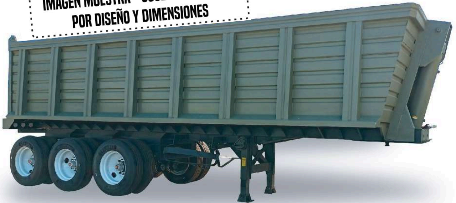
IMAGEN MUESTRA - SUJETA A CAMBIOS POR DISEÑO Y DIMENSIONES